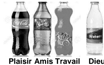
Plaisir Amis Travail Dieu

Si tu commences avec Dieu, tu peux trouver le bon équilibre.